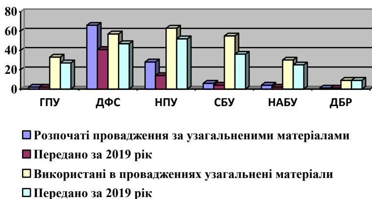
Рис. 3. Кількість розпочатих та використаних у кримінальних провадженнях узагальнених матеріалів за 2019 рік.

України, Міністерством внутрішніх справ України, Службою безпекою України № 103/162/384 від 11.03.2019 року (далі – Порядок) [7]. За цим Порядком реалізуються повноваження закріплені у п. 5 ч. 4 Положення за наступними етапами: підготовка матеріалів до правоохоронних органів (з зазначенням опису операції та її зупинення); надання службою матеріалів; реєстрація та облік; розгляд відповідними правоохоронними органами; отримання інформації про хід та результат розгляду; інформування про зупинення операцій. З метою передачі матеріалів до правоохоронного органу, Держфінмоніторинг експертною комісією приймає відповідне рішення. Яскравими показниками є підготовка у 2019 році 893 матеріалів, які включають зокрема й додаткові матеріали. Лідером по направленню узагальнених матеріалів є Державна фіскальна служба (158 узагальнених матеріалів та 60 додаткових узагальнених матеріалів) (рис.3).